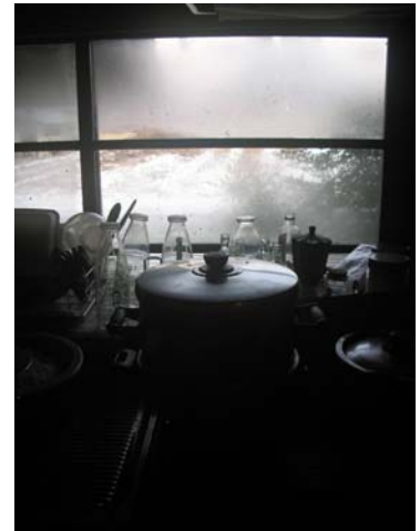
外は雪。静かな山里の冬。

暦の上では、まだこれからが寒さの本番。皆さま風邪やインフルエンザにはくれぐれもお気をつけ下さい。