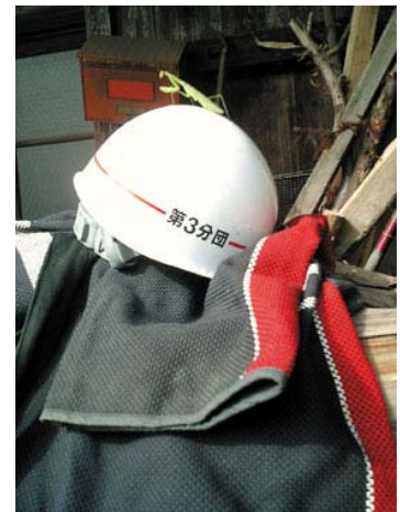
この法被を着て出動です。